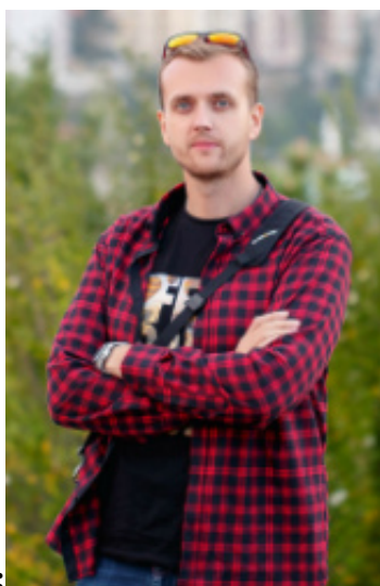
Андрій Акатсьєв, фотограф:

Студентські роки мої були яскраві, багато було всього, але вже тепер я часто думаю, що можна було ще більше дізнатися, побачити. Тому, як десь зустрічаюся зі студентами, то дуже раджу максимально використовувати час і можливості, подивитися, всюди побувати».