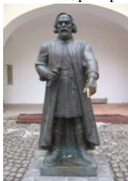
Федір Корятович - племінник великого литовського князя Ольгерта, а дід Федора

У 1396 р. право на володіння замком Паланок отримав родич короля Жигмунда I - Подільський князь Федір Корятович.